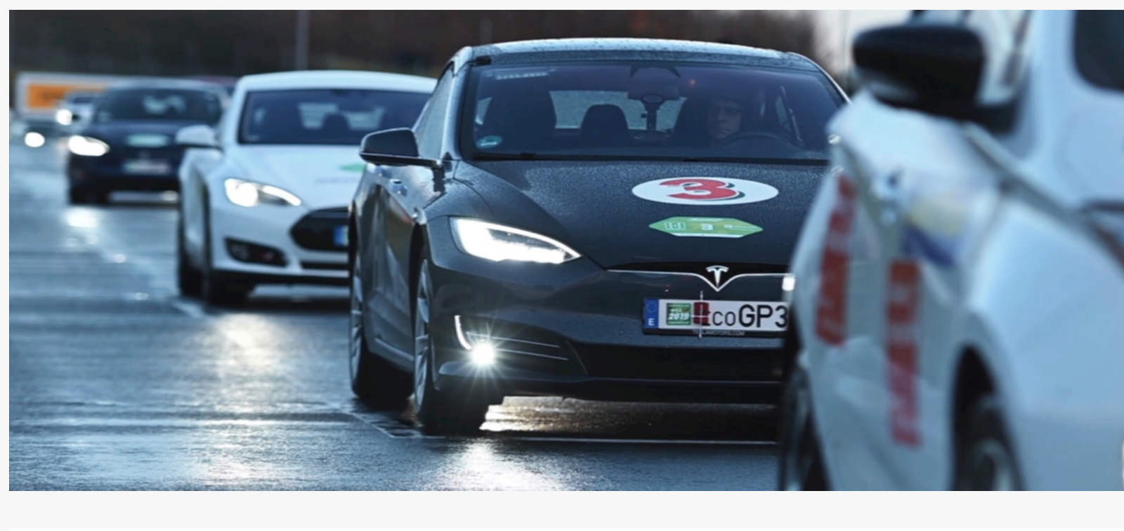
Bereit zum durchstarten