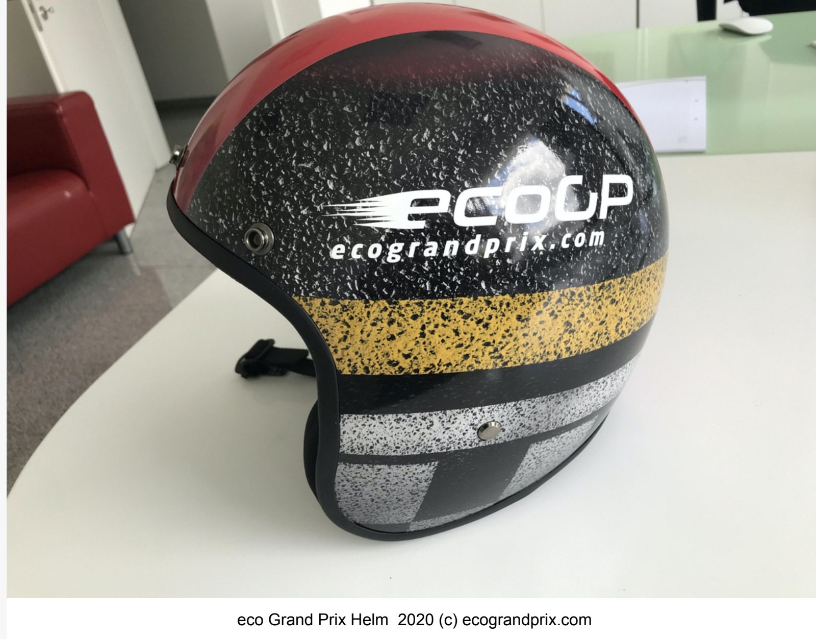
eco Grand Prix Helm 2020

Wer gerne aus unserem Katalog vom TÜV zertifizierten und durch mich getesteten 5m 22kW Typ2 Ladekabel (175€) über "STOP POLLUTION" Masken (5€) oder eco Grand Prix Tassen (10€) bis hin zum neuen Helm (145€) einkaufen möchte, der kann sich über den neuen eco Grand Prix Online Shop freuen, der am Tag der Veranstaltung online gehen wird.