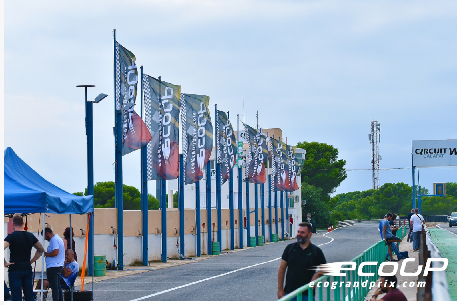
eco Grand Prix Calafat 2019