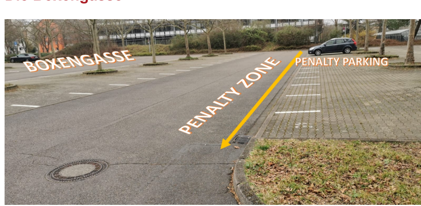
Boxenzone - Rathaus am Stühlinger Freiburg

Dieses Mal werden wir vom Parkplatz des Rathaus am Stühlinger in Freiburg aus starten. Die Teams werden sich auf die Parkplätze der Boxengasse aufstellen und die Penalty Zone ist zur Einfahrt für diejenigen die die Punkte parkend absitzen müssen.